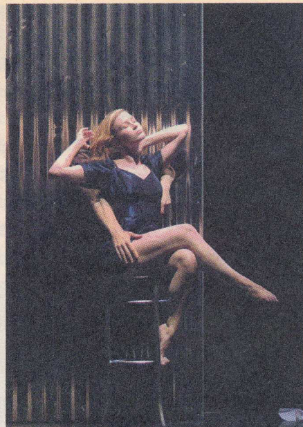
Hoop en verlangen worden simpel, doeltreffend en ontroerend verbeeld.

langzaam tot het beseft dat de kicks die zij najoegen, hen op de langere termijn eigenlijk alleen maar ongelukkiger maken. Behoeftbevrediging blijkt iets heel anders te zijn dan geluk. En zo is 'Guts/Kicks' een pittig tweeluik geworden, dat behalve het bieden van vermaak, jongeren ook uitdaagt dieper te graven dan de buitenkant. Er is dus een